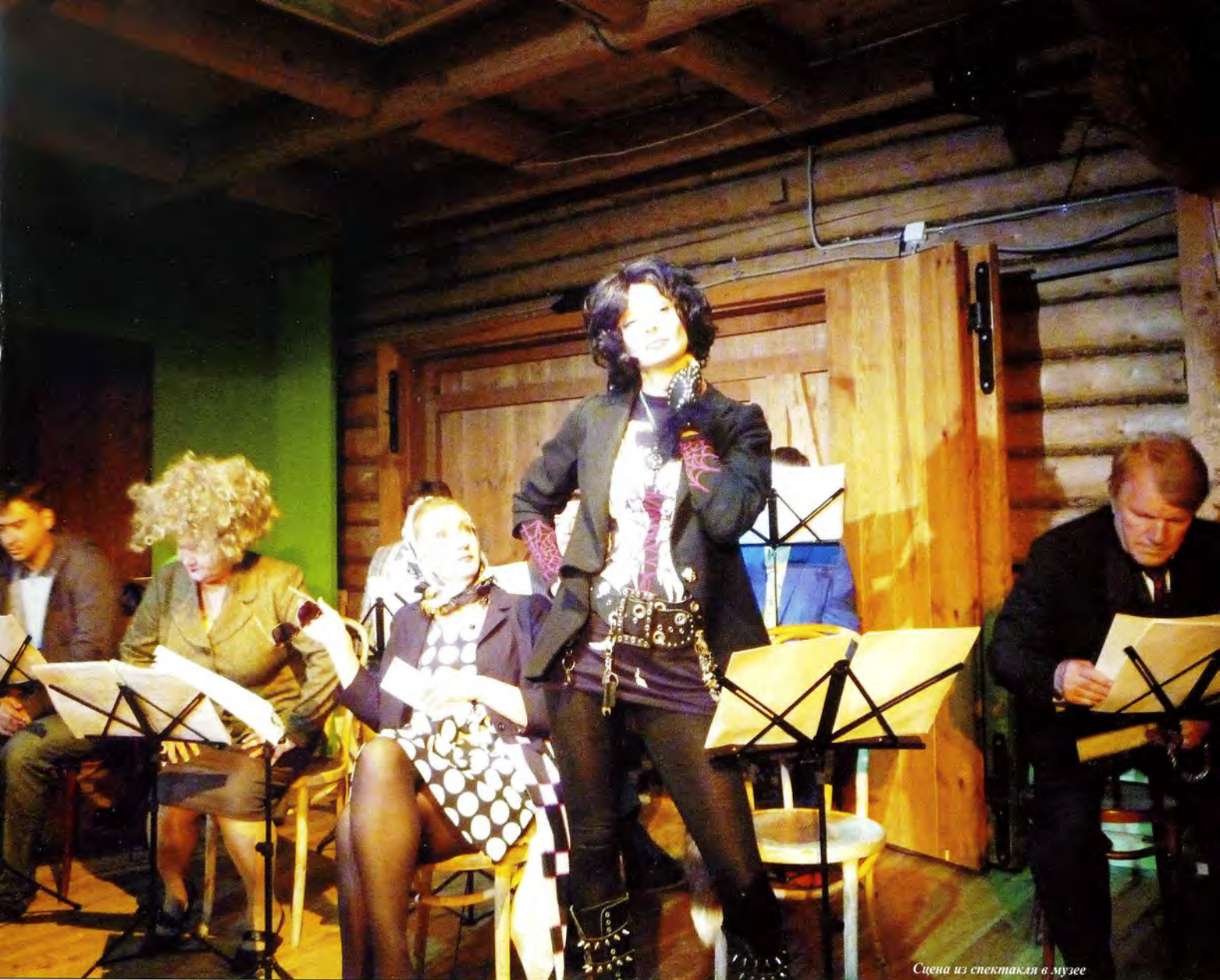
Сцена из спектакля в музее

идеи, мировоззрение свидетельствуют о том, что он — человек будущего. В том мире, в том времени, в котором ему выпало жить, его не понимают. Окружающие его люди существуют «в другом измерении», он среди них одинок. Он находится как бы над этой суетой, над их страстями и помыслами. Он — чужой среди своих... Но он абсолютно уверен в правильности того, что делает. Наверное, Аркадина считает, что Костя — человек не талантливый. Но, на мой взгляд, Константин затмевает их всех! И его мать чувствует это. Она видит опасность, и ее очень тревожит приближение соперника, который может поколебать устои ее творческой жизни. Думаю, что это беспокоит и Тригорина. Увидев часть его спектакля, они поняли, что проиграли. Они сами никогда в жизни до такого не додумались бы. Они даже не понимают эти новые театральные формы.