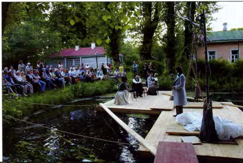
Сцены из спектакля на пруду «Аквариум»

– На мой взгляд, эта пьеса абсолютно интимная, глубоко личностная: писатель в ней «путешествует» внутри собственной души. И в этой душе много аллюзий и ассоциаций, в ней бродит немало литературных образов. В ней очень зримо и осязаемо присутствует образ Ги де Мопассана. Между «Чайкой» и произведениями Мопассана существуют явные переклички. И мне кажется, что «Чайка» – это абсолютно «мопассановская» пьеса. Ведь Мопассан – это не только аналитическое исследование социума, но и безжалостный психоанализ самого себя. А Чехов в «Чайке» с такой